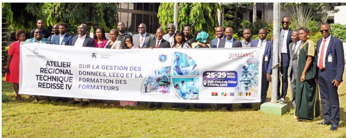
Photo de famille après l'ouverture de l'atelier, le 25/11/2024

Lomé/Togo, le 25/11/2024 , ce lundi, s'est ouvert à Lomé/Togo, un atelier de formation de cinq (5) jours pour les responsables et experts des laboratoires de santé humaine, santé animale et de l'environnement, consacré à la gestion des données des laboratoires, la formation continue et l'Evaluation Externe de la Qualité (EEQ) dans les pays bénéficiaires du Projet REDISSE IV.